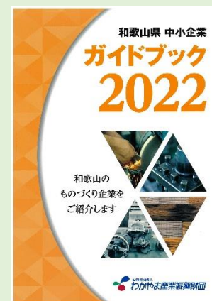
和歌山県中小企業ガイドブック2022